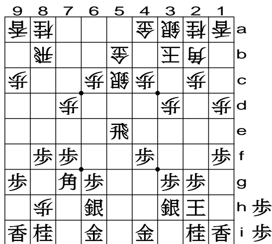
(1). После \Delta P'8h . Ведёт к позициям (2) и (4).

Но после \Delta Rх5e для чёрных опасно контратакующее судзи \Delta P8f \Delta Pх \Delta P'8h (1). Целевой ход \Delta P'8h – это атака лишь пешкой и ладьёй, но в данном частном случае он работает. Ведь если \Delta Вх , то \Delta Rх8f , и защититься чёрным будет трудно. Например, если \Delta G7h , то белые смело и решительно сыграют \Delta Rх8h+ \Delta Gх \Delta В'5e .